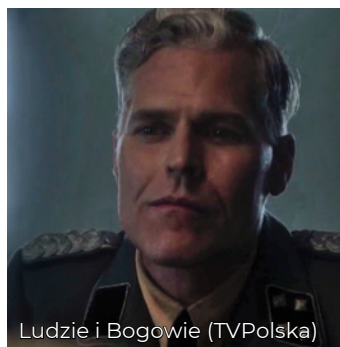
Ludzie i Bogowie (TVPolska)