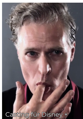
Casting für Disney +