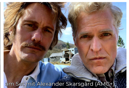
am Set mit Alexander Skarsgård